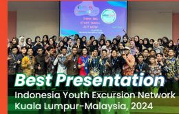
Best Presentation Indonesia Youth Excursion Network Kuala Lumpur-Malaysia, 2024