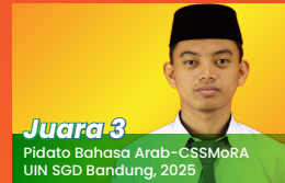
Juara 3 Pidata Bahasa Arab-CSSMoRA UIN SGD Bandung, 2025