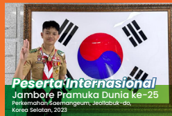
Peserta Internasional Jambore Pramuka Dunia ke-25 Perkemahan Saemangeum, Jeollabuk-do, Korea Selatan, 2023