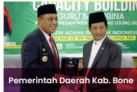
Pemerintah Daerah Kab. Bone