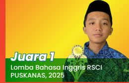
Juara 1 Lomba Bahasa Inggris RSCI PUSKANAS, 2025