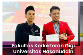
Fakultas Kedokteran Gigi Universitas Hasanuddin