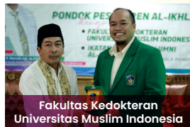
Fakultas Kedokteran Universitas Muslim Indonesia