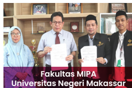
Fakultas MIPA Universitas Negeri Makassar