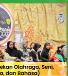
Seni Olahragra, Seni, dan Bahasa)