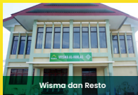
Wisma dan Resto