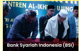
Bank Syariah Indonesia (BSI)