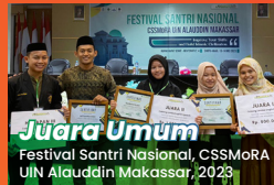
Juara Umum Festival Santri Nasional, CSSMoRA UIN Alauddin Makassar, 2023