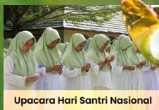
Upacara Hari Santri Nasional