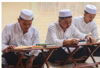
Pembelajaran Intensif Qiro'atul Kutub