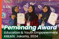
Pemenang Award Education & Youth Empowerment KREASI, Jakarta, 2024