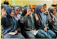
Bimbingan Intensif Masuk Perguruan Tinggi