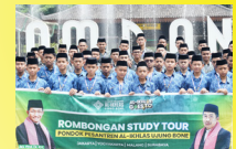
Goes to Java