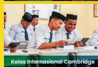
Kelas Internasional Cambridge