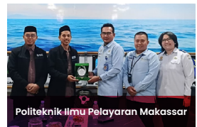
Politeknik Ilmu Pelayaran Makassar