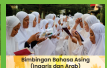
Bimbingan Bahasa Asing (Inggris dan Arab)