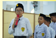
Program Matrikulasi Bahasa dan Ibadah Santri Baru