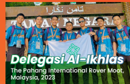
Delegasi Al-Ikhlash The Pathang International Rover Meet, Malaysia, 2023