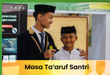
Masa Ta'aruf Santri