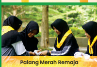
Palang Merah Remaja