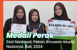
Medali Perak Esai Nasional, Pekan Ilmuwan Muda Nasional, Bali, 2024