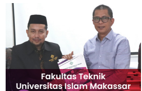
Fakultas Teknik Universitas Islam Makassar