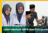
Laboratorium MIPA dan Komputer