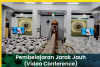
Pembelajaran Jarak Jauh (Video Conference)