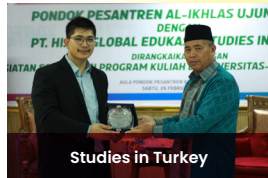
Studies in Turkey