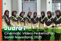
Juara 1 Cinematic Video-Perkemahan Santri Nusanantara, 2025