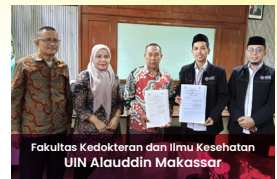
Fakultas Kedokteran dan Ilmu Kesehatan UIN Alauddin Makassar