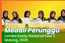
Medali Perunggu Lomba Essay Nasional Fest 3 Malang, 2025