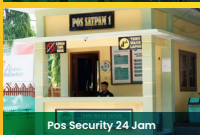
Pos Security 24 Jam