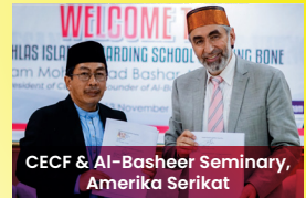
CECF & Al-Basheer Seminary, Amerika Serikat