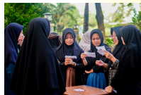
Perkampungan Bahasa Asing Arab dan Inggris