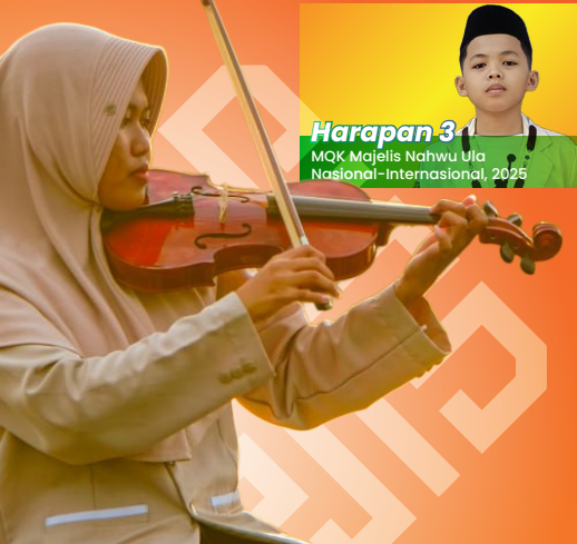
Harapan 3 MQK Majelis Nahwu Ula Nasional-Internasional, 2025